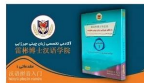
مقدماتی ۱ (آموزش پین یین و خط چینی) (HSK1)

در قسمت جزئیات می‌توانید رمز عبورتان را تغییر دهید.