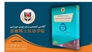
مقدماتی از آموزش پین یین و خط چینی (HSK1)

در قسمت جزئیات می‌توانید رمز عبورتان را تغییر دهید.